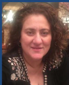
Βάσω Αποστολοπούλου Καθηγήτρια Ανοσολογίας Πανεπιστήμιο Victoria, Αυστραλία

«Η Αντικαρκινική έρευνα είναι η καλύτερη πρόληψη»