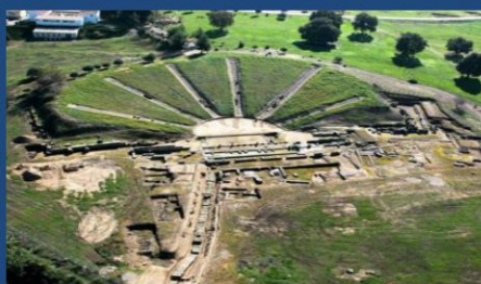
Θέατρο Αρχαίας Ήλιδας