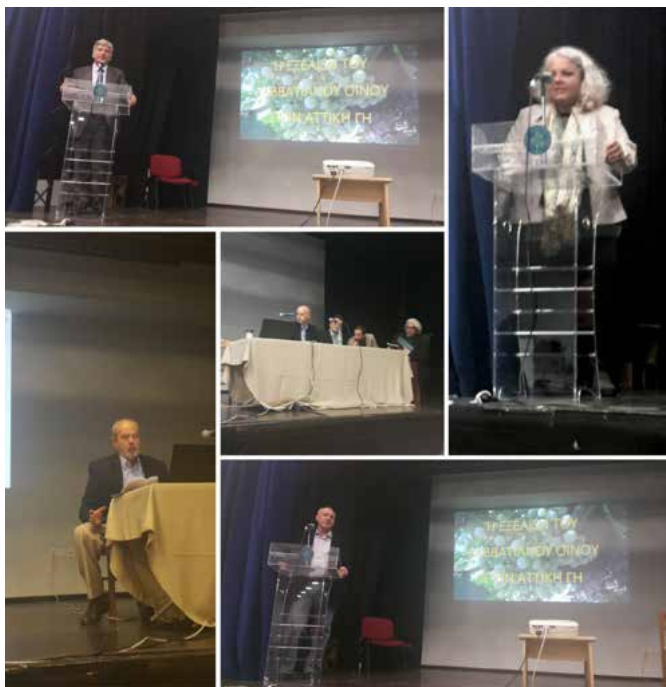
Εικόνα 1 Από αριστερά προς τα δεξιά: